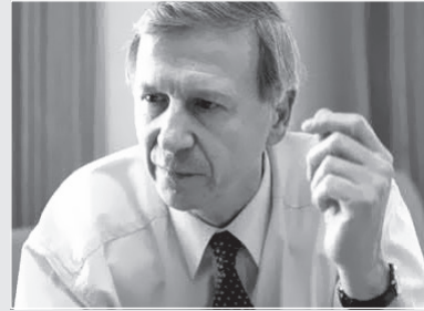
Anthony Giddens (1938-)

Britanyalı sosyolog Anthony Giddens’a göre faille toplum arasında bir ikili ontoloji oluşturmak doğru olmaz. Yapı faile, fail de yapıya içkin olarak ele alınmalıdır. Buna göre yapı faillerin zihnindeki “kurallar”dan ve toplumsal eylemi olanaklı kılan “kaynaklar”dan oluşur. Faillerin gündelik rutin ve bilinçli pratiklerinde ifadesini bulan bu yapılaşma süreci, çoğunlukla toplumsal yapıların yeniden üretilme süreci olarak yaşanırken, kimi durumlarda ise faillerin kaynakları etkin kullanmalarıyla zihinlerindeki kurullarla birlikte bu yapıları da bizzat değiştirme süreçlerine dönüşebilir.