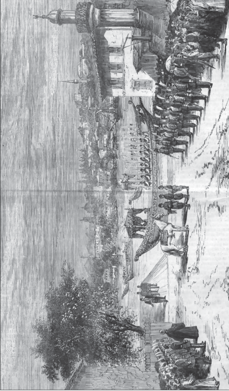
Kendi dönemindeki diğer imparatorluklar gibi Osmanlı İmparatorluğu'nda da 19. yüzyıl, "görünürlüğün" törenlerle ve ihtişamla sağlandığı bir yüzyıldı. L'illustration 15 Ağustos 1908, Edhem Eldem Koleksiyonu.