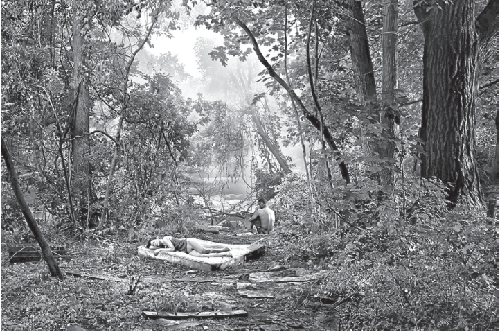
Gregory Crewdson, isimsiz , yaz 2006, fotoğraf.