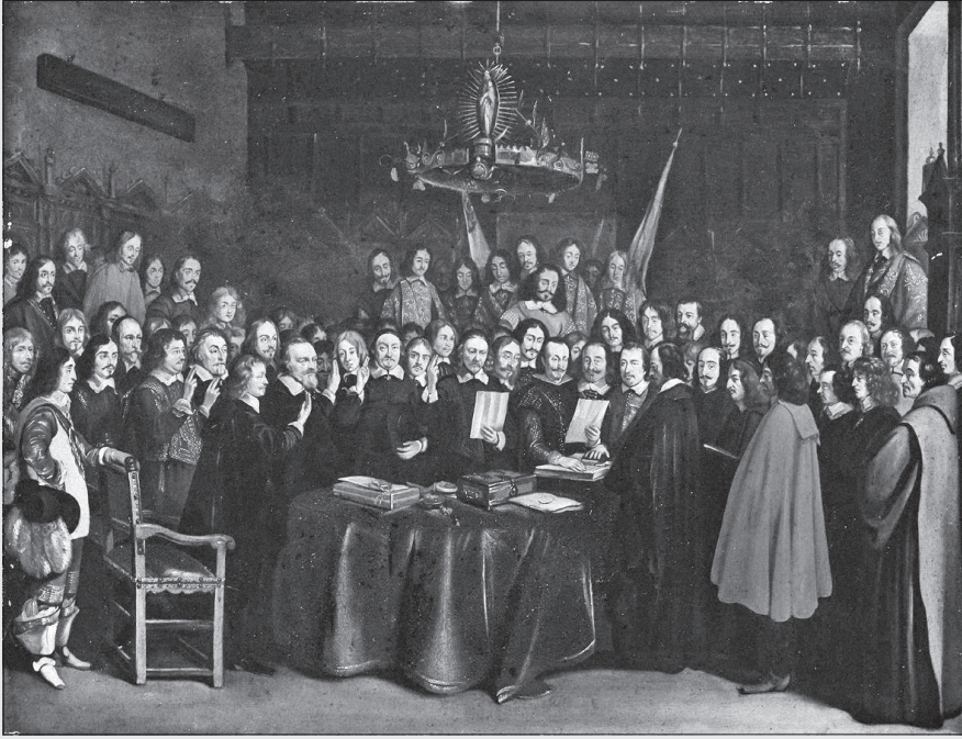
Gerard ter Borch, "Münster Barışının İmzalanması", 1648.

Vestfalya Antlaşmaları (1648), Avrupa'nın neredeyse tüm siyasal güçlerini içeren, ancak esas olarak protestan Alman prensliklerinin, Katolik Kilisesi'nden özerkliklerinin ve Hollanda'nın İspanya'dan bağımsızlığının mücadelesi olan Otuz Yıl Savaşları'nı bitiren antlaşmalar dizisidir.